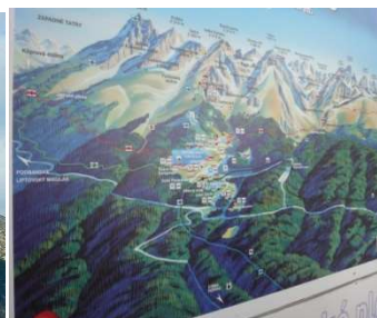
Karta Štrbsko pleso

Pridružite nam se na osmodnevnom planinarskom izletu u čarobne Slovačke Tatry, poznate po svojim slikovitim vrhovima, dolinama i jezerima. Ovaj plan pruža priliku za istraživanje nekih od najljepših prirodnih čuda regije uz raznolik program prilagođen različitim razinama kondicije.